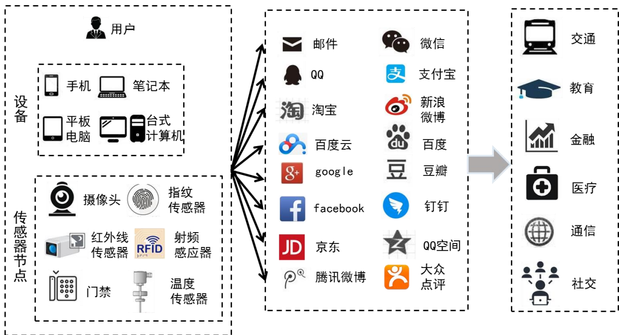
图 2-1 网络主体和网络应用爆炸式增长