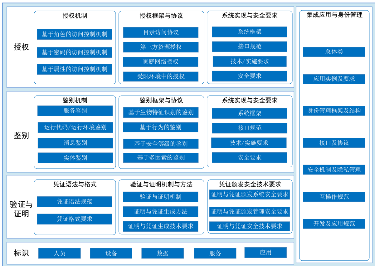
图 7-1 鉴别与授权标准体系框架

结合我国网络发展趋势，基于国内外鉴别与授权技术应用及标准化现状，在分析鉴别与授权标准化需求的基础上，适应电子认证 2.0 的发展，构建了鉴别与授权标准体系框架（见图 7-1）。该标准体系框架由五个类别的技术标准组成，分别为：标识类标准、验证与证明类标准、鉴别类标准、授权类标准和集成应用与身份管理类标准。