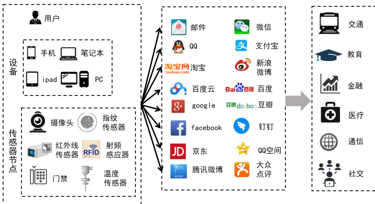
图 2-1 网络主体和网络应用爆炸式增长

如何唯一标识数量巨大且不断变化的网络实体，如何通过身份标识唯一体现和反映复杂的实体间控制或从属关系以便强化追踪与管理，如何支持同一实体在不同应用中的实名或匿名等不同的安全需求确保不同应用和用户实体安全，都是新形势下电子认证技术和标准的重要问题。