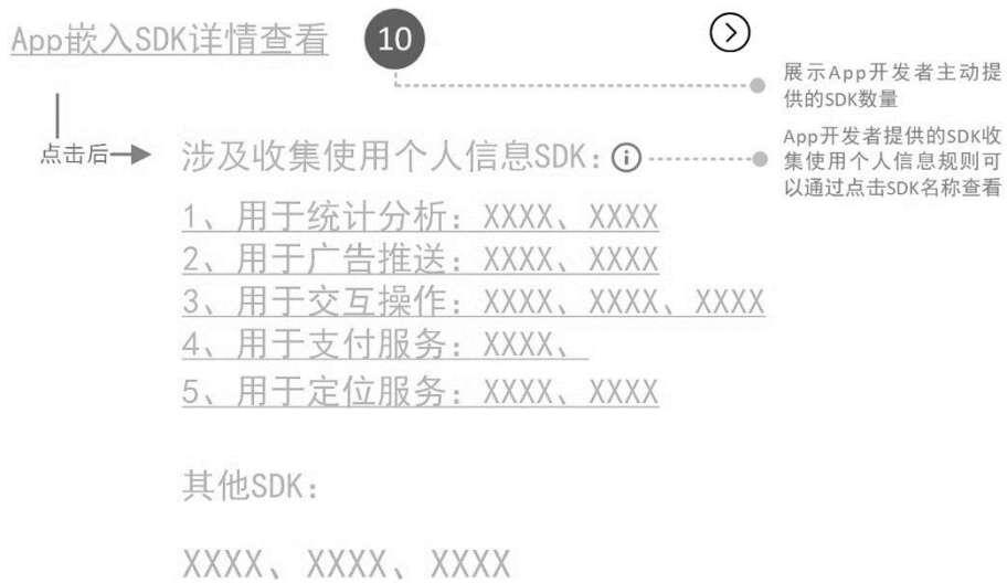
图B.3 App内嵌第三方SDK情况透明化展示示意图