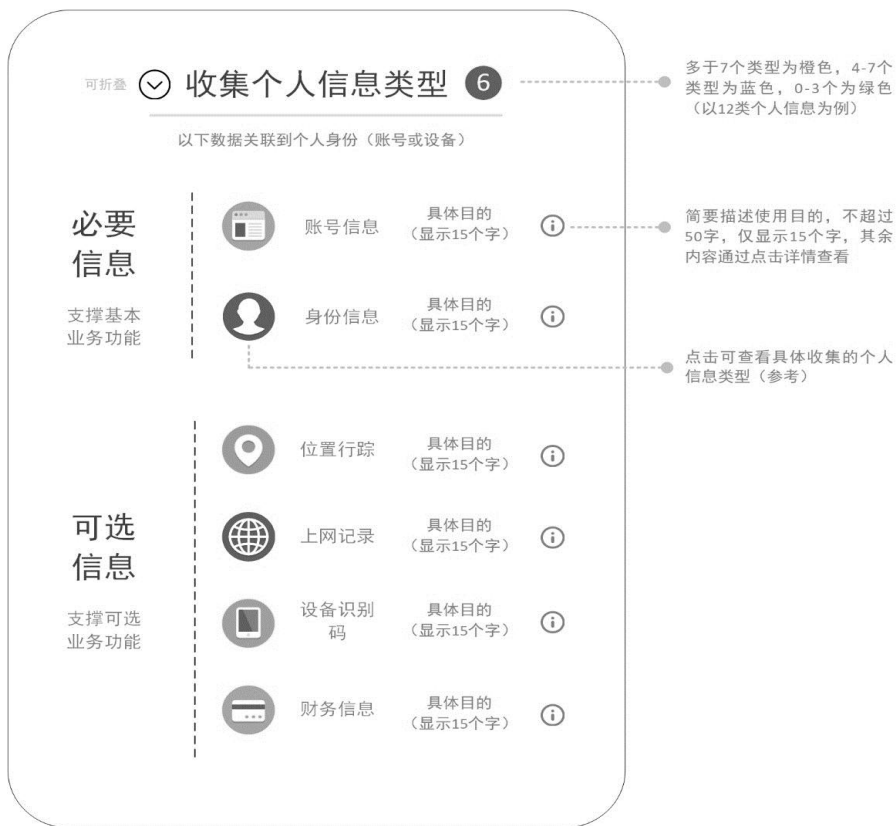
图B.1 App收集个人信息类型透明化展示示意图